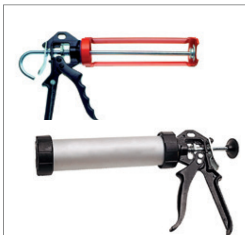
Pistola per Silicone