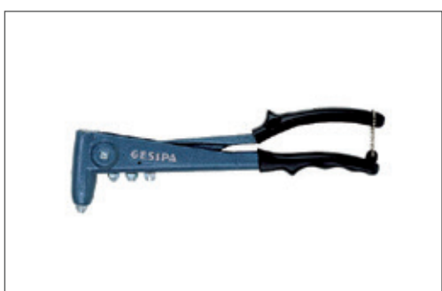
Rivettatrice Manuale Gesipa