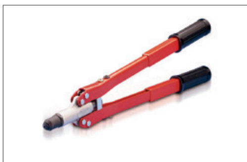
Rivettatrice Manuale Grande