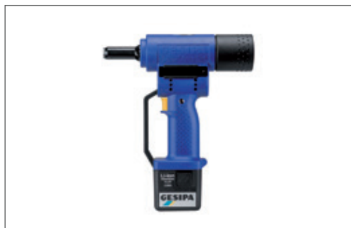
Rivettatrice a Batteria Gesipa